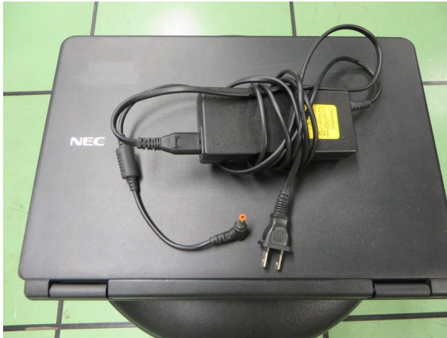
① NEC ノート PC